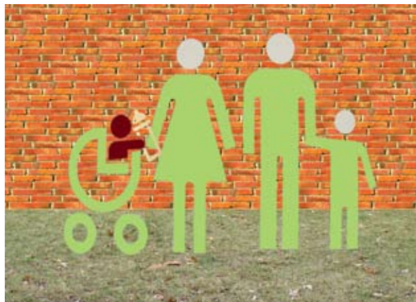
Portrait de famille, 2006 tirage jet d'encre 50 x 70 cm