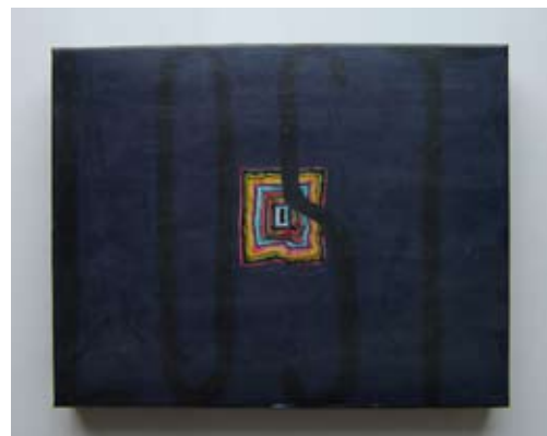
Lost, 2003 Techniques mixtes et collage sur carton 37 x 27,4 x 5,2 cm