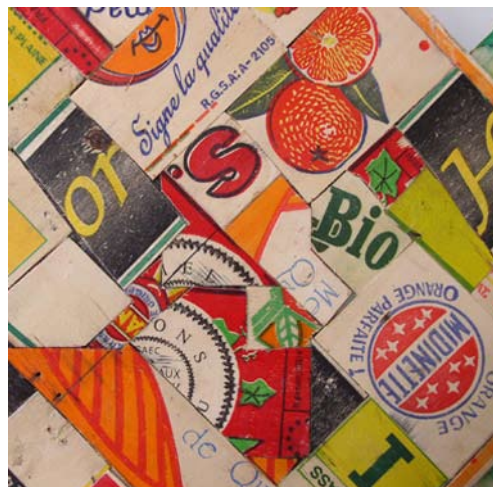
Opus Incertum, (détail)