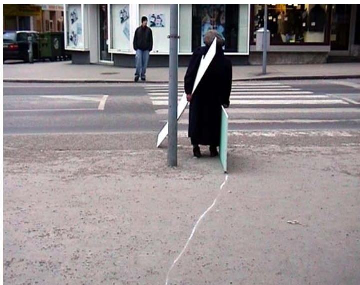
photogramme de la vidéo Jusque-là, 2004