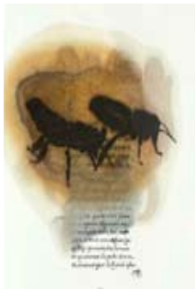
José-Maria Sicilia "Sancular de Barrameda G" 48 X 37,5 cm monotype

Salette de couleurs et de signes s'articulent en des compositions dynamiques, pour créer une sorte d'alphabet imaginaire, de labyrinthe dont on s'amuse à suivre le fil emmêlé du trait.