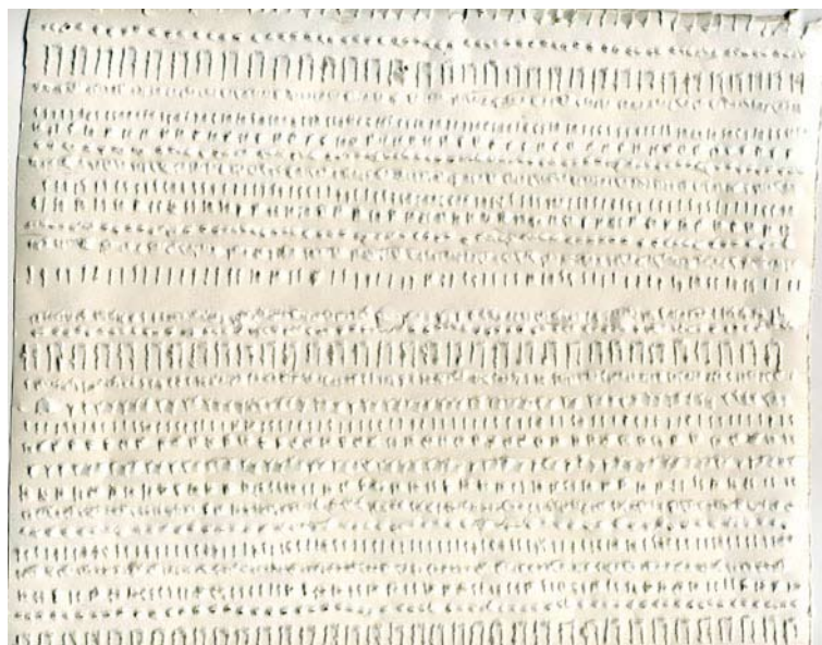
Ecritures, 2005 (détail) 35 x 25 cm

1997 Constructions, Abbaye de Beaulieu (82)