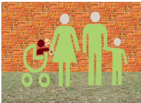
Portrait de famille, 2006 tirage jet d'encre 50 x 70 cm