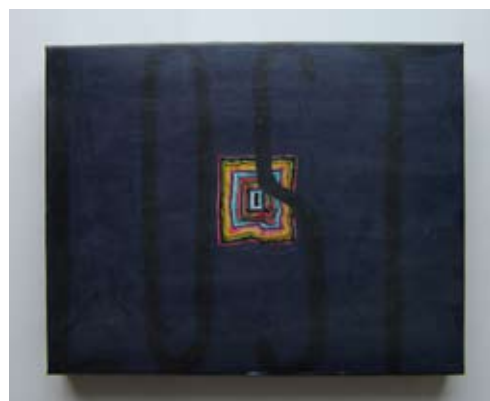
Lost, 2003 Techniques mixtes et collage sur carton 37 x 27,4 x 5,2 cm