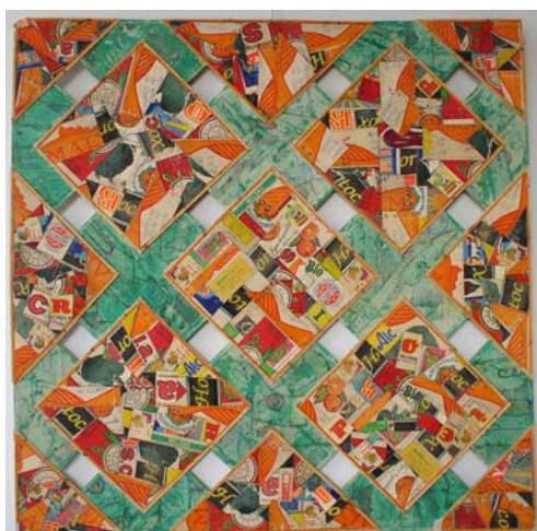
Opus Incertum, 125 x 125 cm