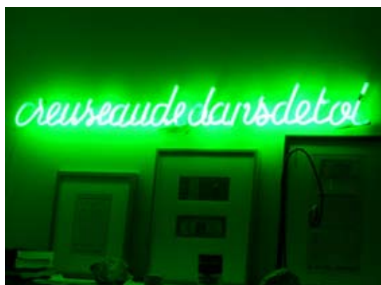
Creuseaudedansdetoi, 1994 Tubes de néon formés, pigment 10 x 110 x 3 cm

1995 Centre Culturel Français et Am Rondell Platz, Karlsruhe Chapelle des Cordeliers et Musée de Sarrebourg, Sarrebourg