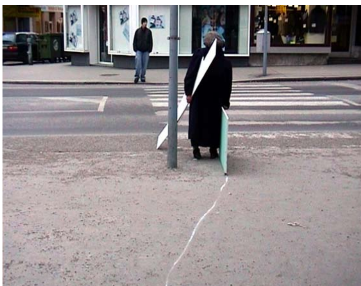
photogramme de la vidéo Jusque-là, 2004