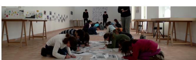
Atelier POM*POMpidou ! lié à l'exposition PAGES, 2011.

Du mec qui s'était super bien déguisé à Celui qui adore la viande pourrie en passant par Celui qui imite super bien un chien et Celui qui à présent y voyait du pied , avec Bernard Quesniaux le monde se retrouve sens dessus dessous et c'est bien plus drôle comme ça !