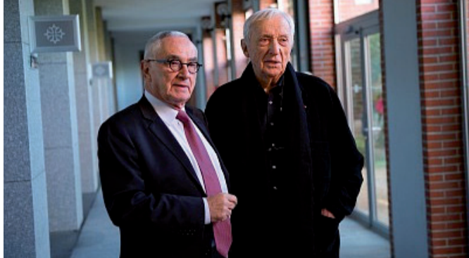
Martin Malvy et Pierre Soulages.

Pierre Soulages était aux côtés de Martin Malvy afin de présenter les artistes retenus en 2012 pour résider aux Maisons Daura, à Saint-Cirq-Lapopie.