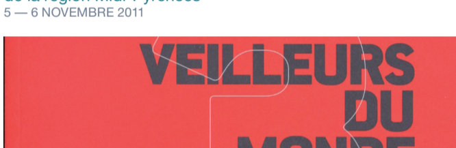
Couverture du catalogue Veilleurs du monde 3, Parcours d'art contemporain en vallée du Lot, 2009 (détail) .