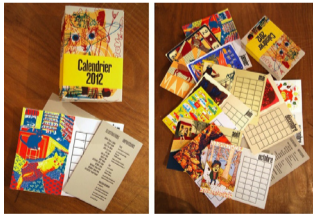
Imprimerie Trace, Calendrier 2012, 14x22cm, sérigraphie et typographie