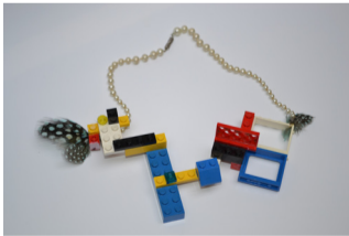
Muriel Rodolosse, Collier, légos, perles et plumes