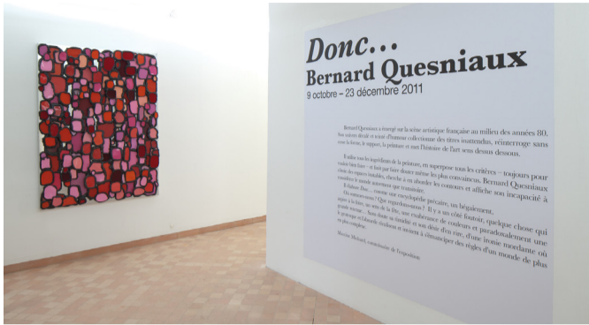
Bernard Quesniaux, Fluid Make Up , vue de l'exposition Donc... Bernard Quesniaux, centre d'art contemporain, Cajarc, 2011.