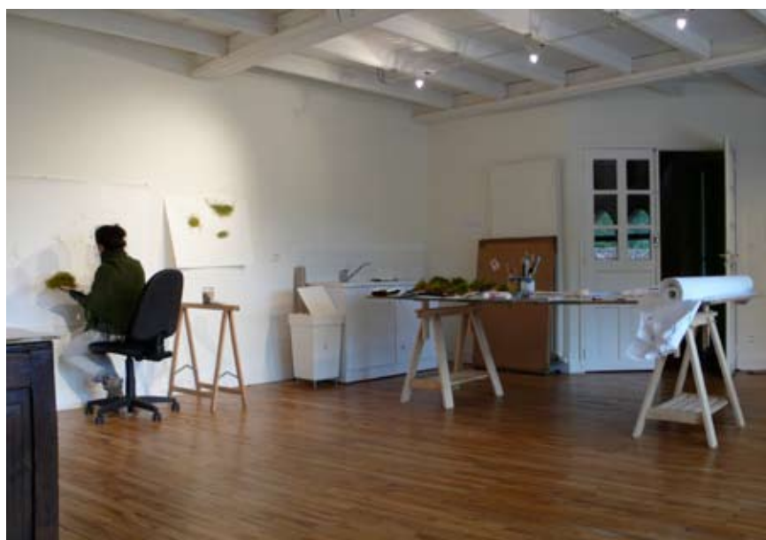
Marie Thébault, vue de son atelier aux Maisons Daura, automne 2008.