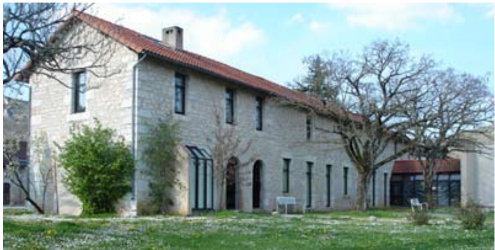
Le centre d'art contemporain à Cajarc.

Le Centre d'art contemporain Georges Pompidou est voué à rapprocher les publics du meilleur de la création contemporaine, émergente ou confirmée, de la scène française et internationale.