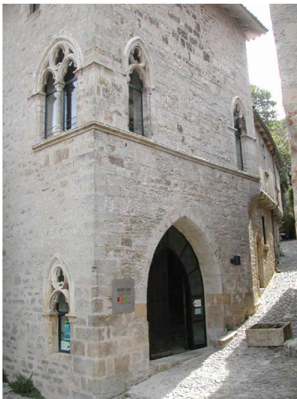
Les Maisons Daura à Saint-Cirq-Lapopie