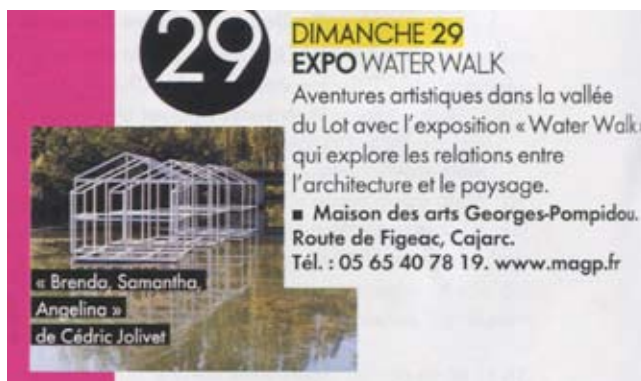
ELLE, 27 août 2010