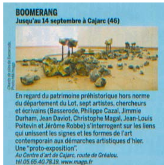
LES INROCKUPTIBLES, 26 Août au 1er Septembre 2008