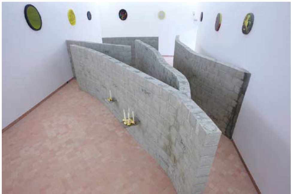
Kees de Goede, Paume, Petite main et Main et Peintures , vue de la salle 3 de l'exposition AXIOMA, 2009.