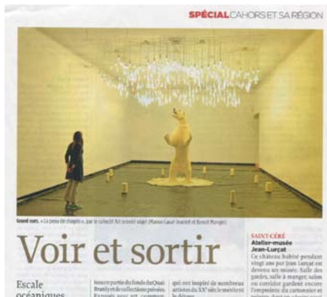
LE POINT, Jeudi 20 août 2009