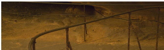
Jonathan Hernández, Garde-corps , 2011, photographie. COURTESY DE L'ARTISTE

CAJARC / CALVIGNAC / LARNAGOL / SAINT-CIRQ-LAPIOIE / CABRERETS