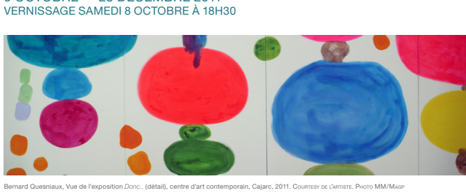
Bernard Quesniaux, Vue de l'exposition Donc... (détail), centre d'art contemporain, Cajarc, 2011.

Bernard Quesniaux a émergé sur la scène artistique française au milieu des années 80. Sa peinture se dégage peu à peu des aplats pour flirter avec la sculpture. Son univers décalé et teinté d'humour collectionne des titres inattendus, réinterroge sans cesse la forme, le support et met l'histoire de l'art, de la peinture classique à l'art conceptuel, sens dessus dessous.