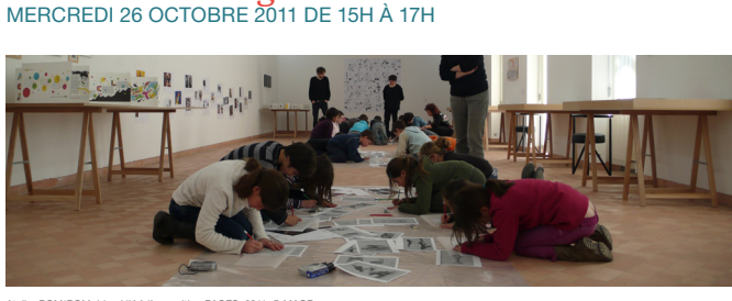
Atelier POM*POMpidou ! lié à l'exposition PAGES, 2011.

Constituant une espèce d'encyclopédie d'un monde imaginaire raisonnablement absurde, Bernard Quesniaux répertorie, en images et en titres, des fragments de récits grotesques et déroutants. Du mec qui s'était super bien déguisé à Celui qui adore la viande pourrie en passant par Celui qui imite super bien un chien et Celui qui à présent y voyait du pied , le monde se retrouve sens dessus dessous et c'est bien plus drôle comme ça!